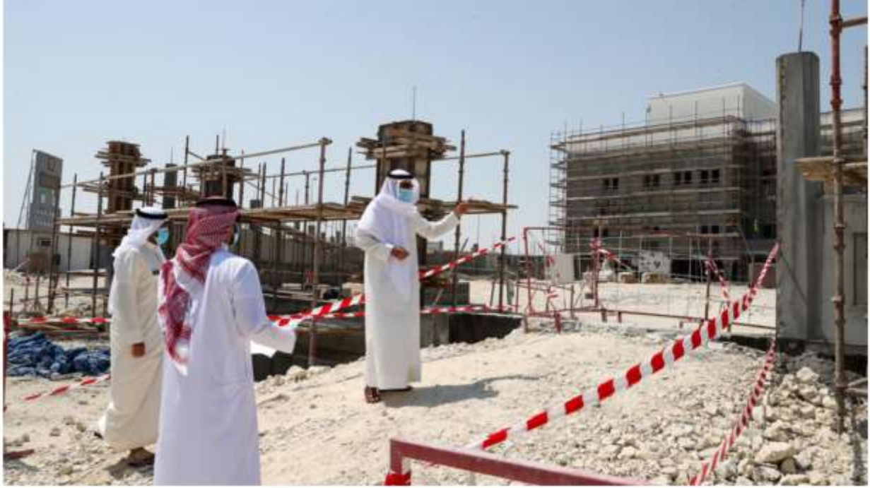
متابعة سمو المحافظ لمرحلة الإنشاء لمشروع مركز مدينة خليفة الصحي والتأكد من سير عمل المشروع بحسب الخطة المعتمدة من قبل وزارة الأشغال وشئون البلديات والتخطيط العمراني